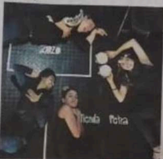
A Cortesía Linda Peña